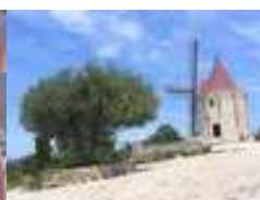
Moulin de Daudet