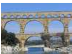
Pont du Gard

Quelques photos pour vous donner envie de demeurer sur place quelques jours et profiter d'un environnement exceptionnel.