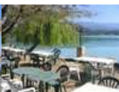
Etang de la Bonde